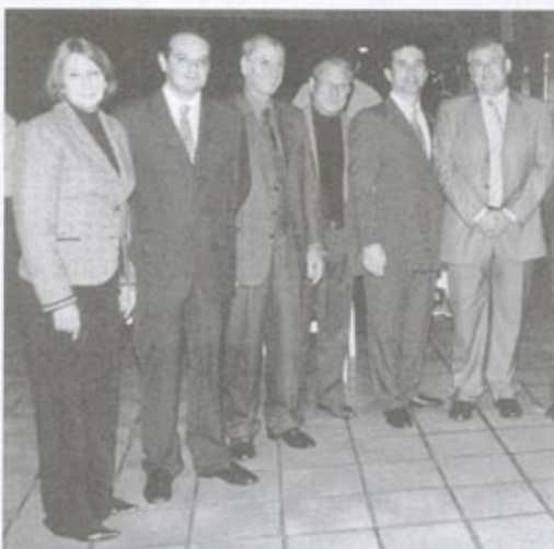
Presidenta del CRE-RJ, el Canciller de España y amigos con el Director General