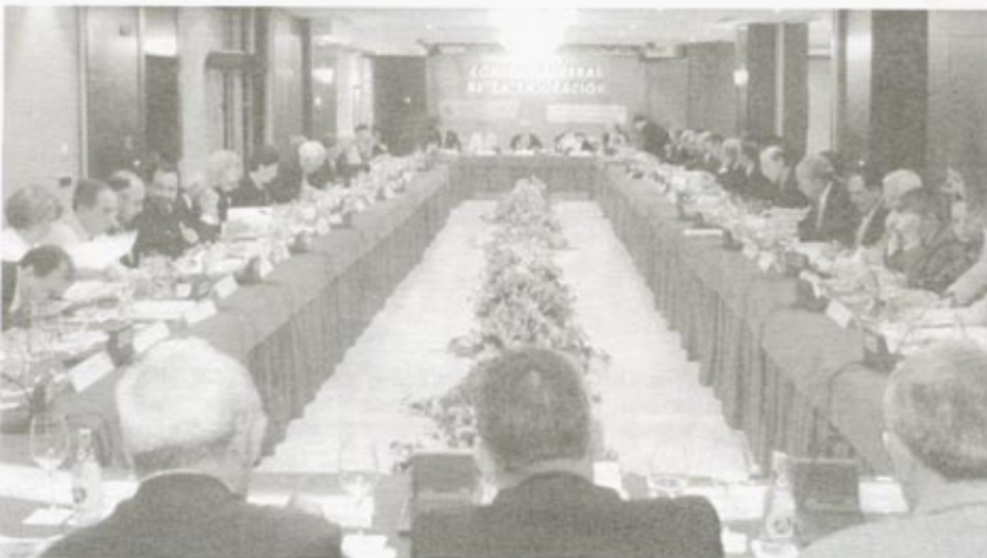
III Pleno del IV mandato del CGE - Santiago de Compostela.

Que el Ministerio del Interior pueda facilitar cursar desde los Consulados la huella digital y el resto de los datos que faciliten a los españoles en el exterior obtener el Documento Nacional de Identidad-DNI .