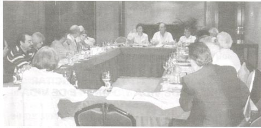
Comisión de trabajo - Socio laboral y retorno.

Homologaciones y convalidaciones: Se solicita la comparecencia de un represen-