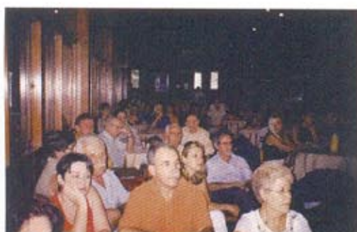
Reunion en Vitória - ES