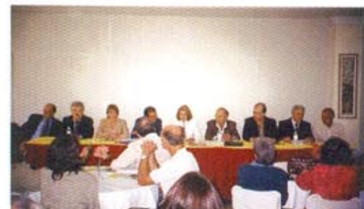
Reunion en Nova Friburgo