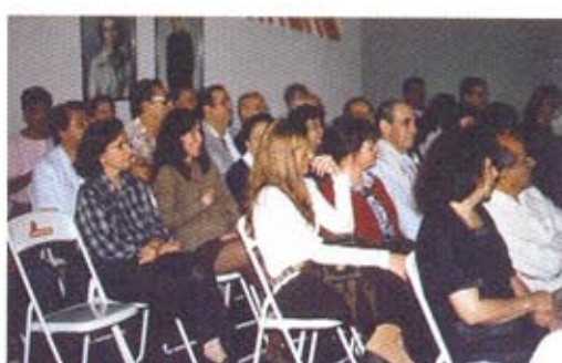
Reunion en la Casa España de Macaé