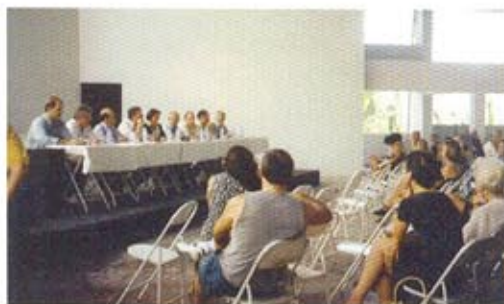
Reunion en el Club Español de Niteroi