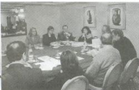
IV Pleno del C.G.E. Comisión de Educación y Cultura - Tema Colegio Español en RJ.

El Congreso brasileño aprobó de forma definitiva la ley que hace obligatoria la enseñanza del idioma español en los colegios públicos y privados.