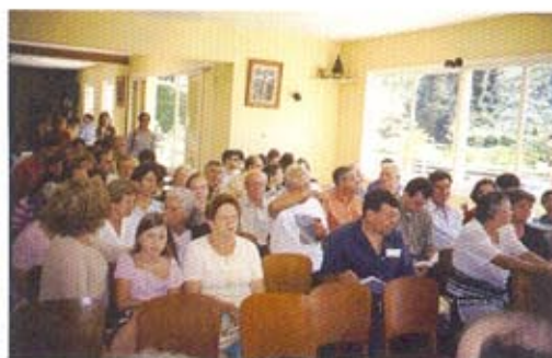
Reunion en la Casa Española de Teresópolis