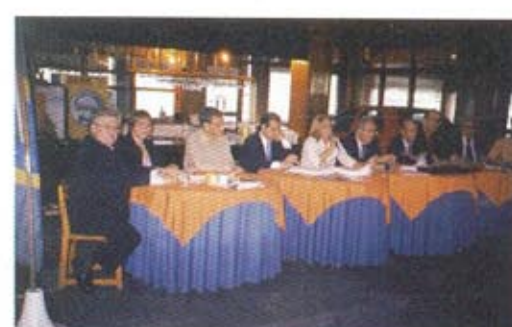
Reunion en Vitória - ES