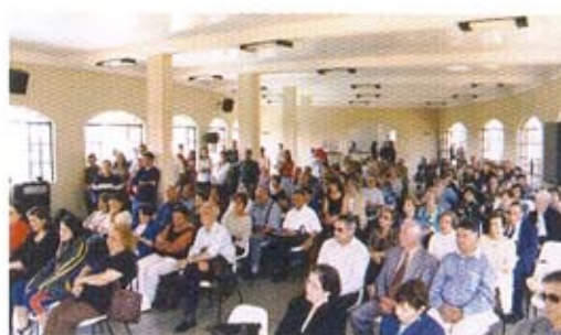
Reunion en el Gramio Español de Belo Horizonte