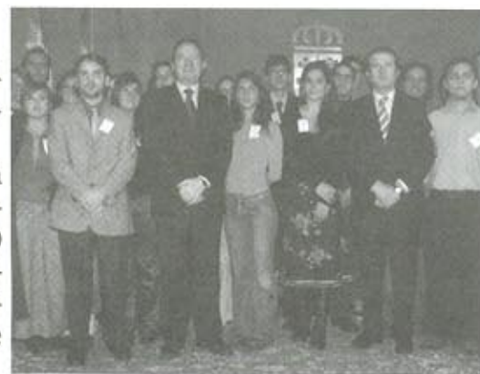
Volver a las raíces.

Mayores informaciones las puedes obtener en la página web www.larioja.org/volveralasraices . o puedes ponerte en contacto con la dirección de correo electrónico volver.raices@larioja.org