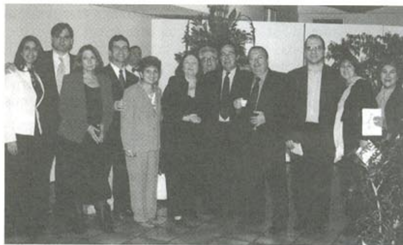
Nélide Piñon con consejeros del CRE y Directivos de Entidades.