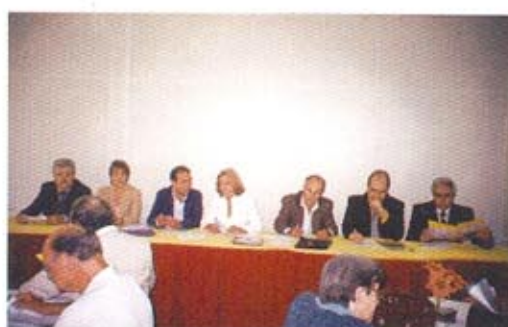
Consejeros del CRE