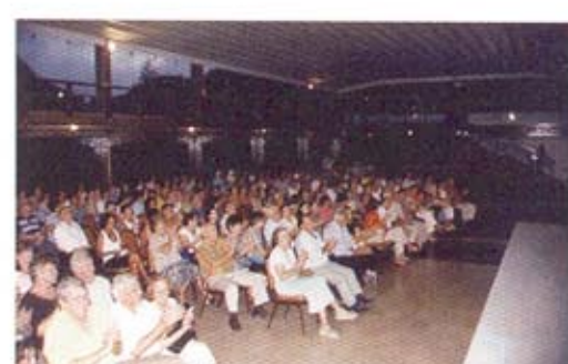
Reunion en Casa de España de Rio de Janeiro

Aun se realizarán este año algunas reuniones del CRE en las ciudades de Nova Friburgo, Macaé y Niteroi, a las que están previamente invitados, y de las que recibirán la oportuna información.